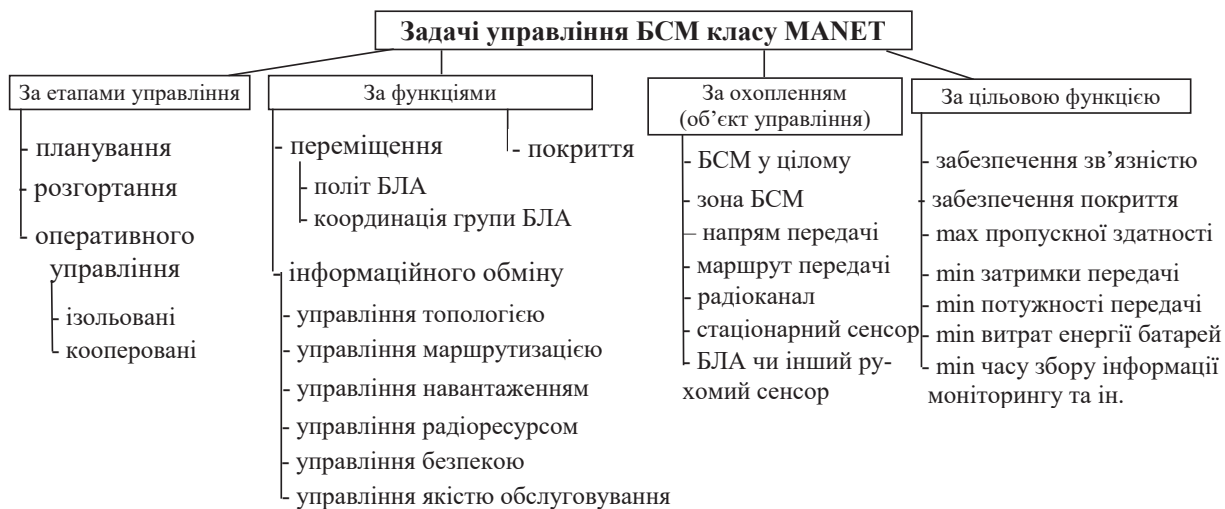
Рис. 2. Класифікація задач управління MANET із ТА